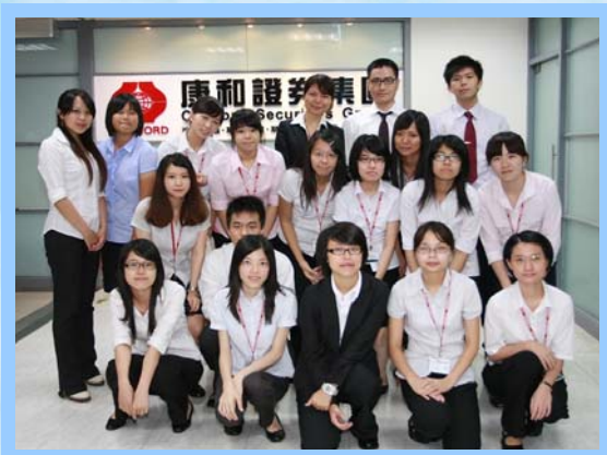
(建教合作活動與同學紀念合影)

展望未來，康和證券集團將努力善盡企業社會責任，落實企業發展和環境共存共榮的理念，維持企業承擔責任的驅動力、符合法令規範及道德意識的運作機制，藉由企業資源、人力投入，以具體行動回饋社會，提升企業、顧客、員工、股東與社會的價值，邁向對社會和地球環境永續經營之路，並向成為「兩岸優質券商的標竿」目標邁進！