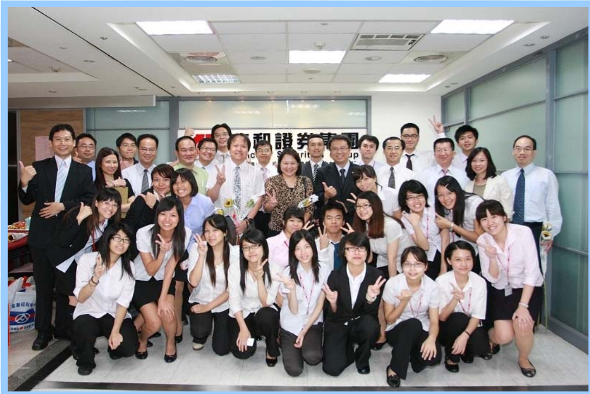
(同仁教育訓練合影)

2. 本公司為回饋員工努力，提高員工配股比例，而依證券交易法第 28 條之 2 規定，買回庫藏股以轉讓於員工。