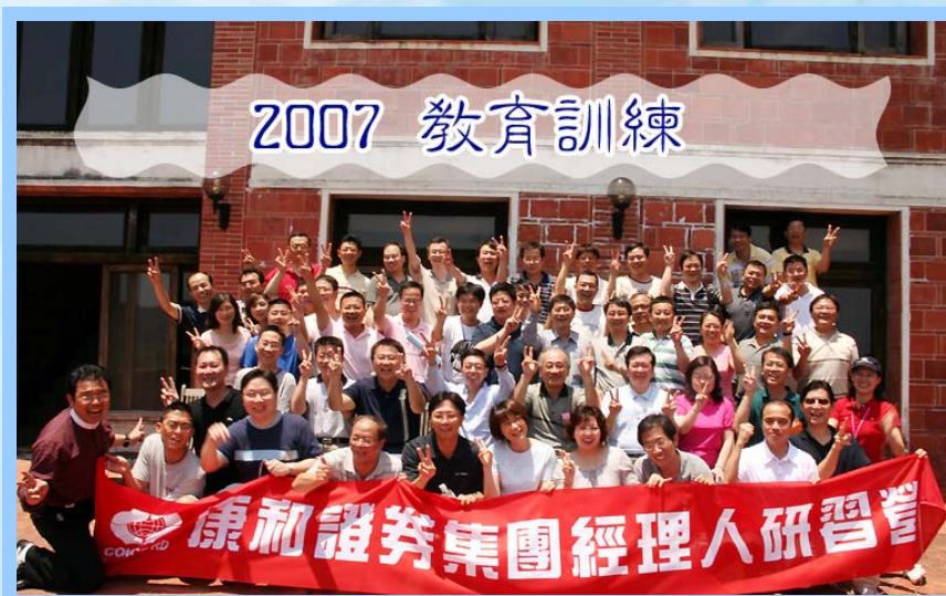
(同仁教育訓練合影)