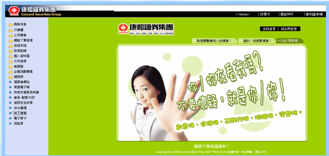
(員工提案網站專區)

本公司於內部網站設置『員工提案』專區，員工提案透過該網站機制提案，由人力資源部按提案可行程度評估執行。為了創造一個更優良的工作環境，本公司鼓勵員工對於公司有任何的建議皆可踴躍提出；對於業務降低成本、提昇業績以及增加工作效能範圍內提出建議方案。