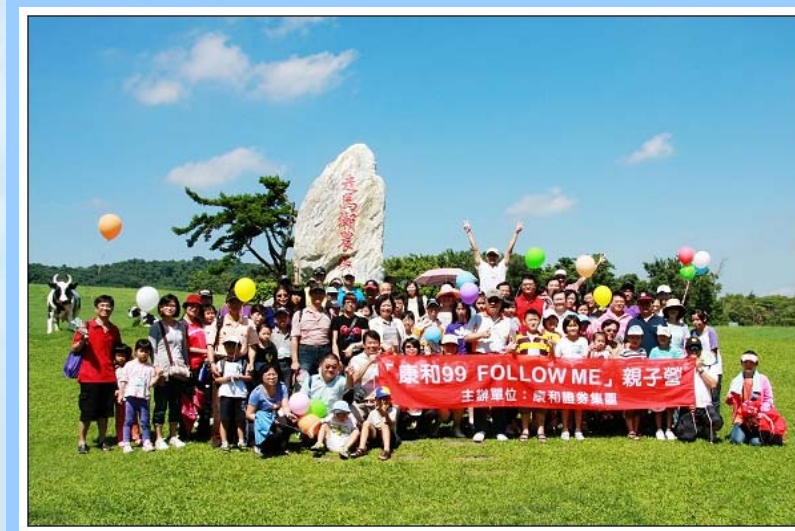
(員工親子營活動照片系列)