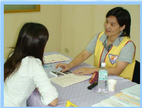
(員工親子營活動照片系列)