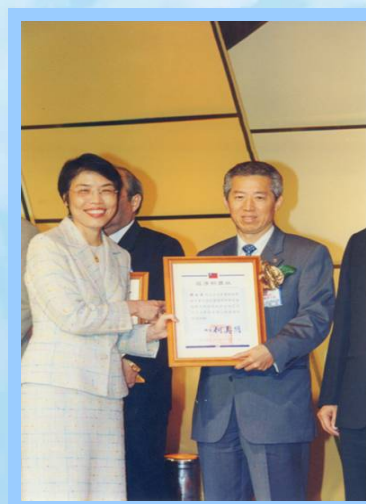
(康和高層榮獲多項獎項)

康和證券獲得國家級金炬獎的肯定，代表康和證券多年來努力不懈追求卓越的穩健經營，受到各界支持及肯定。而康和證券集團秉持一貫的經營理念：誠信、創新、服務第一，全力衝刺財富管理，積極進行改革及轉型，並發展投資銀行之多元化及國際化之業務，朝向投資銀行邁進。