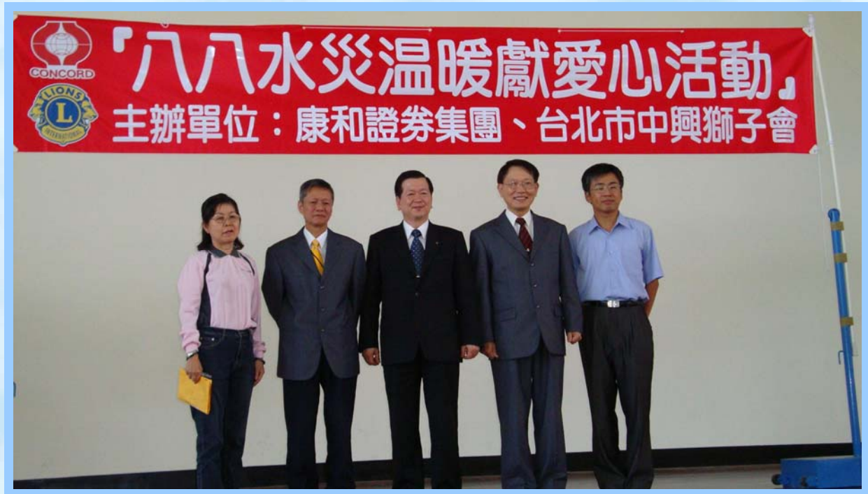
(康和高層參與八八水災溫暖獻愛活動)

2009年「八八水災」造成南台灣嚴重創傷，康和證券集團全體同仁為表達對88水災受災戶的關懷，捐出一日所得，加上公司捐款共募得500萬元做為賑災活動基金。經過數月的實地勘查及災戶評核，日前已分別於屏東林邊、高雄縣鼓山國小、台南縣甲仙鄉鄉公所、麻豆鄉公所、嘉義縣番路鄉鄉公所舉辦賑災活動中，現場發放賑災款給災民、受災學童及孤兒院等，為協助災區盡一份心力。